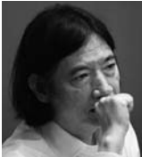
おかし た えいじ 大下 英治 作家

1953年生。大分県出身。1978年「いつも心に太陽を」で舞台デビュー。1987年からテレビ朝日系「世界の車窓から」のナレーションを担当、スポーツ番組「サスケ」などにも出演。日曜劇場の「JIN」において濱口梧陵役で出演。