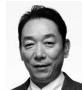
いしまる けんじろう 石丸謙二郎 俳優

1946年生。京都大学大学院博士課程修了。1993年京都大学教授。2002年人と防災未来センター長就任。2009年京都大学を退職（京都大学名誉教授）し関西大学教授に就任。2010年関西大学社会安全学部長、2012年より現職。現在、中央防災会議防災対策実行会議委員。