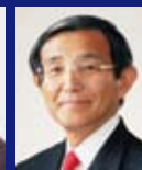
仁坂 吉伸 和歌山県知事

主催/和歌山県、明治大学 共催/内閣府 後援/消防庁、国土交通省、気象庁、毎日新聞社 協賛/ヤマサ醤油株式会社