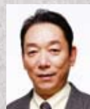
石丸 謙二郎 俳優