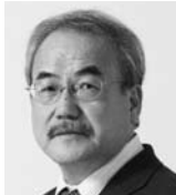
なかばやし いちき 中林 一樹

1944年生。広島大学文学部卒業。1970年「週刊文春」の記者。1983年に独立して作家となる。著書には「十三人のユダ 三越・男たちの野望と崩壊」「美空ひばり・時代を歌う」「闘争！角栄学校」「日本を強くしなやかに 二階俊博の執念」など390冊以上。本年1月には「津波救国（稲むらの火）濱口梧陵伝」を執筆。