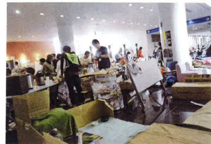
カップ麺にお湯を注ぐ避難者。受け取りに来られない避難者もいる。

4月25日。益城総合体育館から町内の被害多発地域を視察中に、探している小児科医院を見つけ、食アレルギーのある子どもの支援について医院長と意見交換をした。医院長は開業していることを周知して欲しいこと、周辺家屋の倒壊による間接被害除去のためにボランティアの支援を求めている旨を語った。