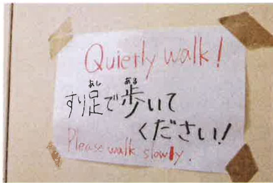
Please walk slowly (ゆっくり歩きましょう)