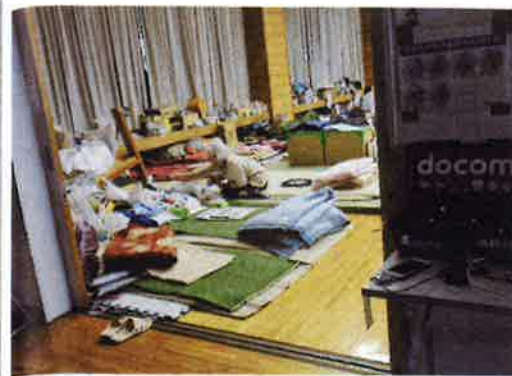
益城総合体育館の避難所

気仙沼の避難所で若い母親に「子どもに食のアレルギーがありますが、対応した食べ物はありませんか」と問われ、対応できなかった経験がある。ご飯しか食べさせられ