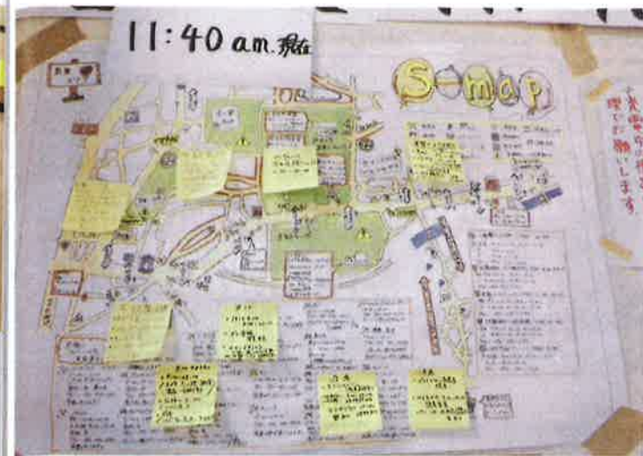
付箋紙に記した生活情報を手作りのマップにリアルタイム掲示。今後の避難所運営にとっても参考となる画期的な取組。

避難所に入った外国人のもとにはそれぞれの国の大使館が迎えの車を出し、自国民を新たな避難先に案内をされたようだ。