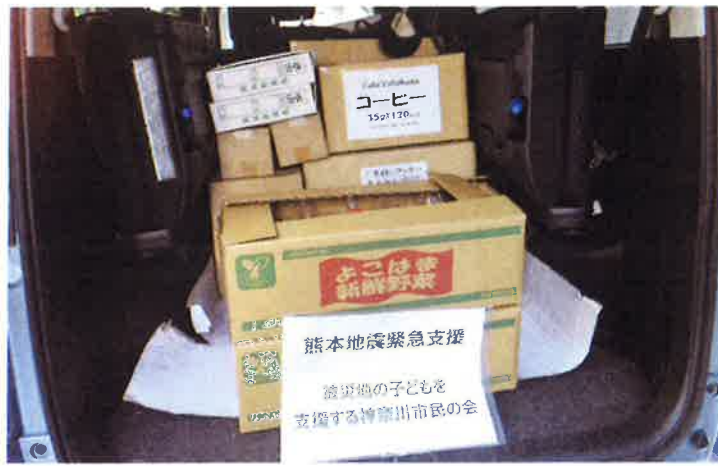
第1陣の支援物資を積み込む。