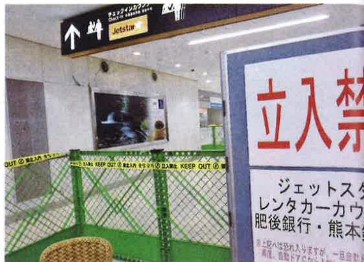
熊本空港1階ロビーの被害

に何人かにエピペン (epipen) を打っているとのことだった。この症状はアレルギーの原因物質に触れ、あるいは食べることで起こる急性のアレルギー反応で、アナフィラキシーショックと言われている。このアレルギーの症状は多様で、末梢血管が拡張することによる血圧の低下やショックによる心拍の低下、除脈になり意識レベルが低下し、体温が上昇する等とされている。