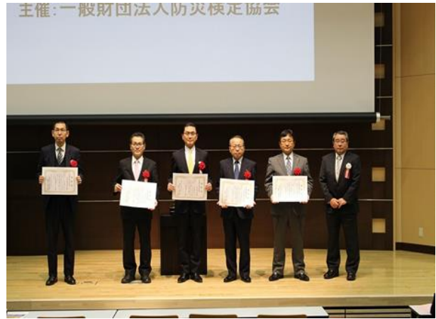
防災検定協会特別賞を受賞した清風学園清風中学校、桃山学院中学校 日本大学中学校、日本大学豊山中学校、佐野日本大学中等教育学校