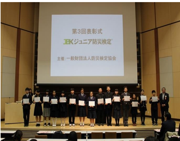
事前課題特別賞を受賞した小中学生