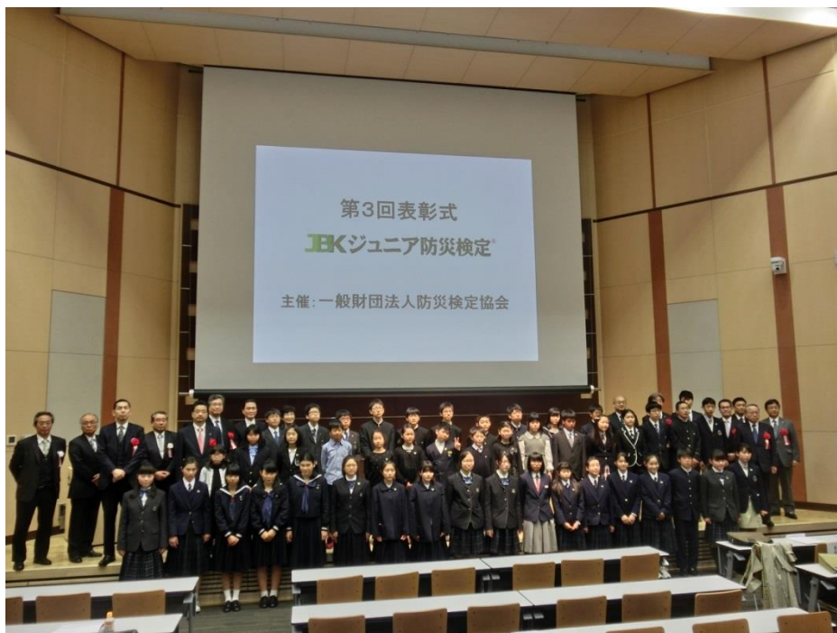
最後に受賞者全員での記念撮影