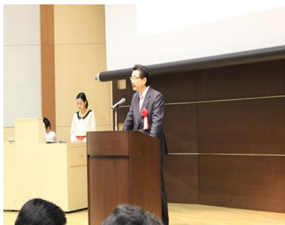
和田勝行文部科学省初等中等教育局 健康教育・食育課課長の来賓挨拶