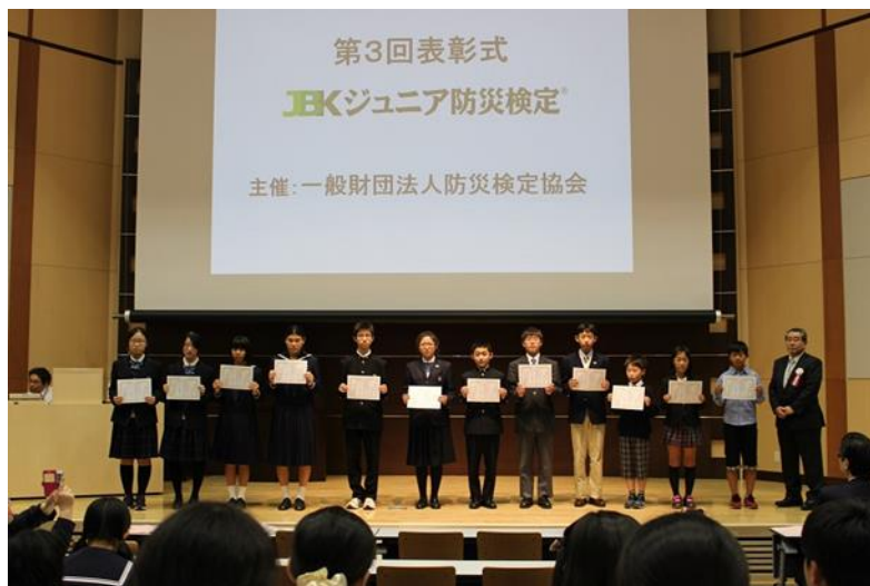
成績優秀者賞を受賞した小中学生