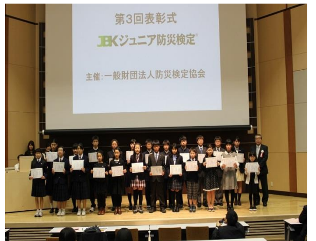
事後課題優秀賞を受賞した小中学生